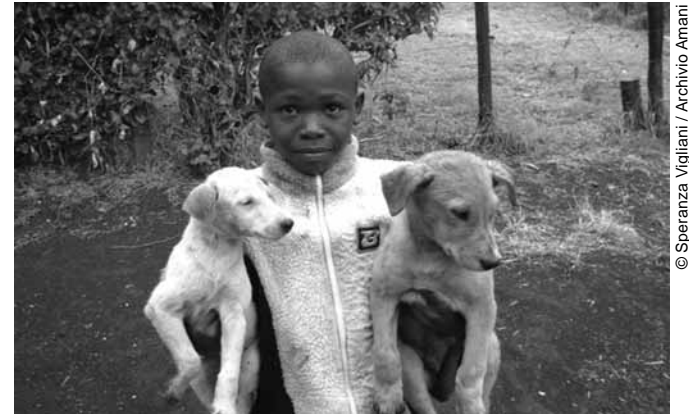
Uno dei bambini del "Piccolo Fratello". A loro gli educatori hanno affidato dei cagnolini di cui prendersi cura.